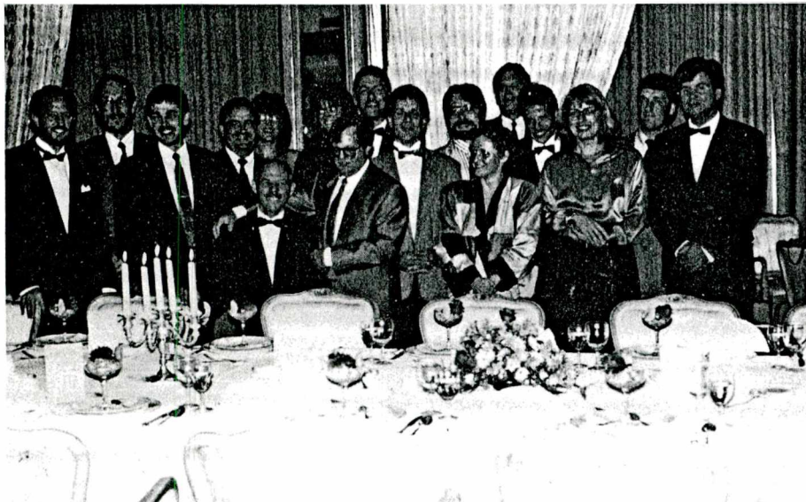
„Farewell Banquet”, de feestelijke afsluiting van het tweede jaar van de Leergang Opleidingskunde.