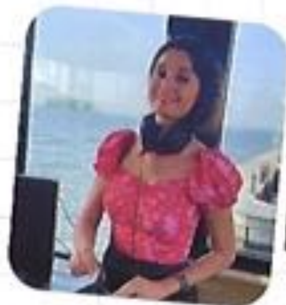
GEESEKE TE GUSSINKLO